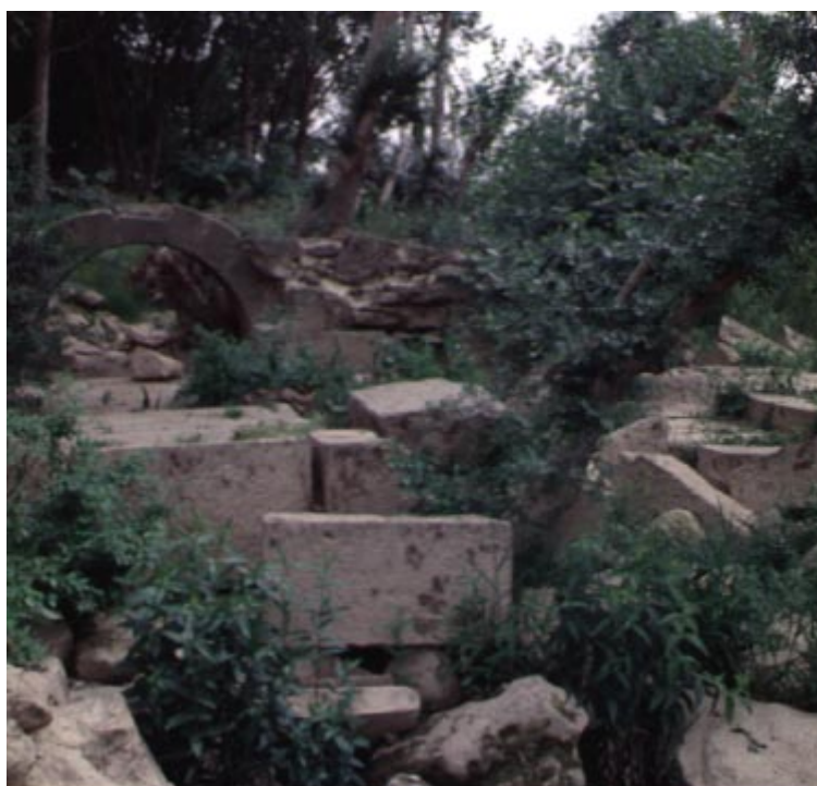
Casa de Norias Oeste