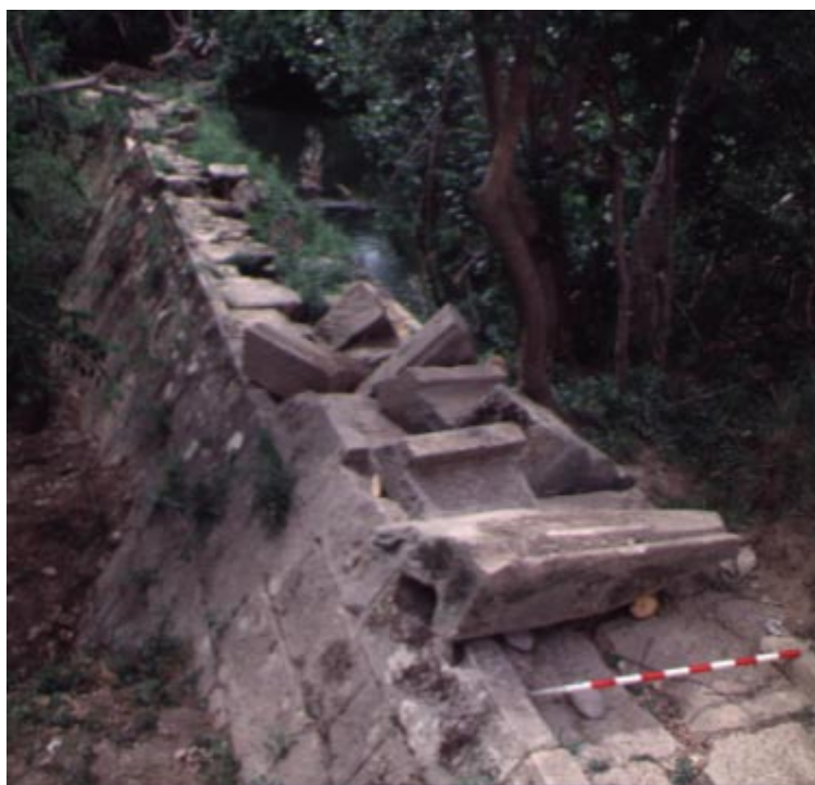
Presas que une las casas de noria