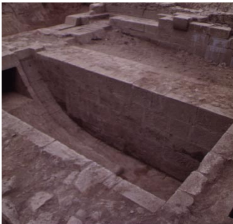
Espacio para albergar la noria.