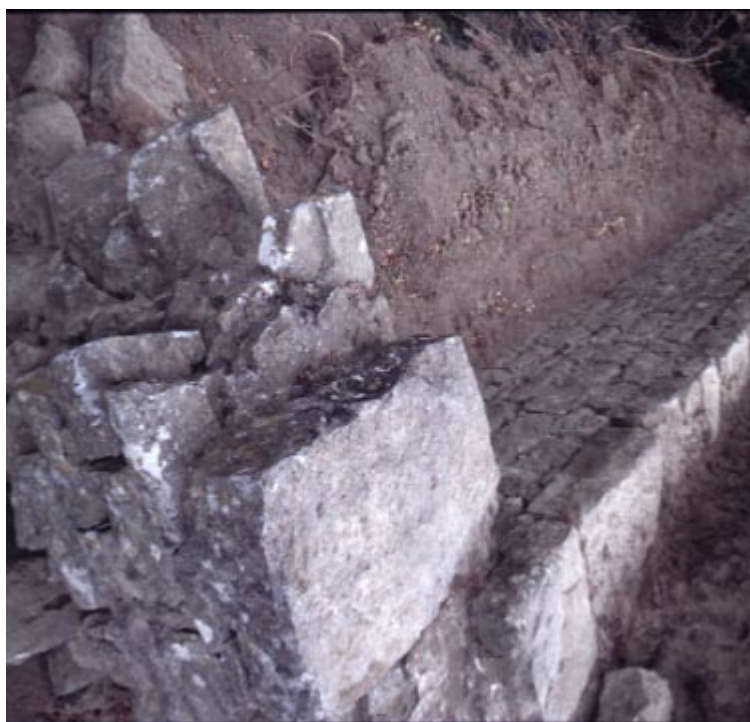
Estribo y zapata. Orilla derecha del río Arga