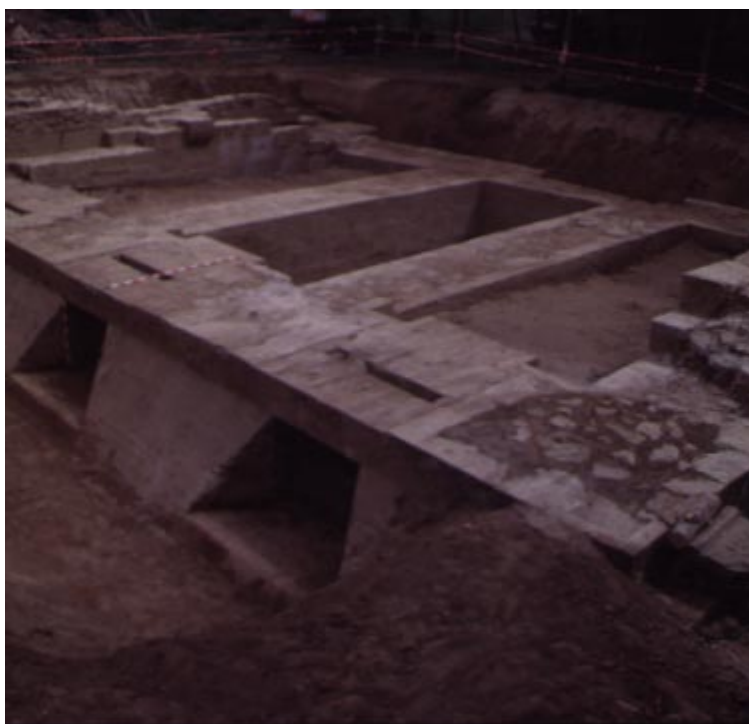
Casa de Norias Este.