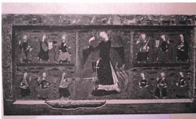
FRONTAL. COLECCION GUALINO. TURIN.

Los tres frontales -Arteta, Góngora y Colec. Gualino 4 - pertenecen a un mismo taller, aunque son obras de distintos pintores, con una unidad estructural, lo que prueba la existencia en Navarra de un taller de gran importancia 5 , sin fecha segura, pues la estructura y técnica pertenecen al siglo XIII y otros elementos decorativos a la pintura navarra de mediados del siglo XIV 6 , siendo todos ellos magníficos ejemplares del llamado estilo franco-gótico o gótico-lineal.