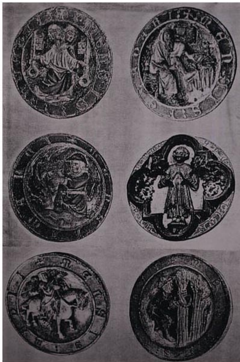
CATEDRAL DE PAMPLONA: Enero a Mayo. Julio.