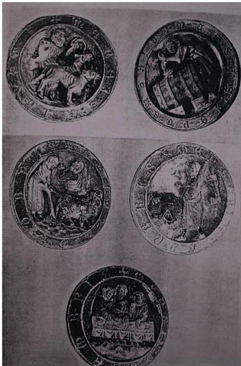
CATEDRAL DE PAMPLONA: Agosto a Diciembre.