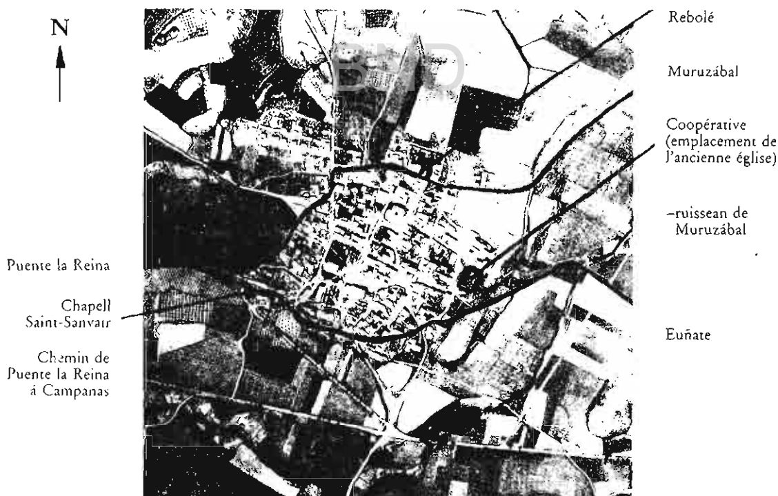
Vue aérienne de Obanos (Mairie).