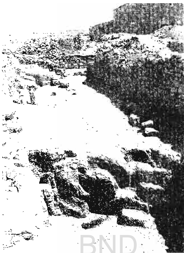
Fot. 4. Casa n.º 5.

Al fondo, junto a la muralla, presenta en los rincones unas pilastras de yeso adosadas a la pared.