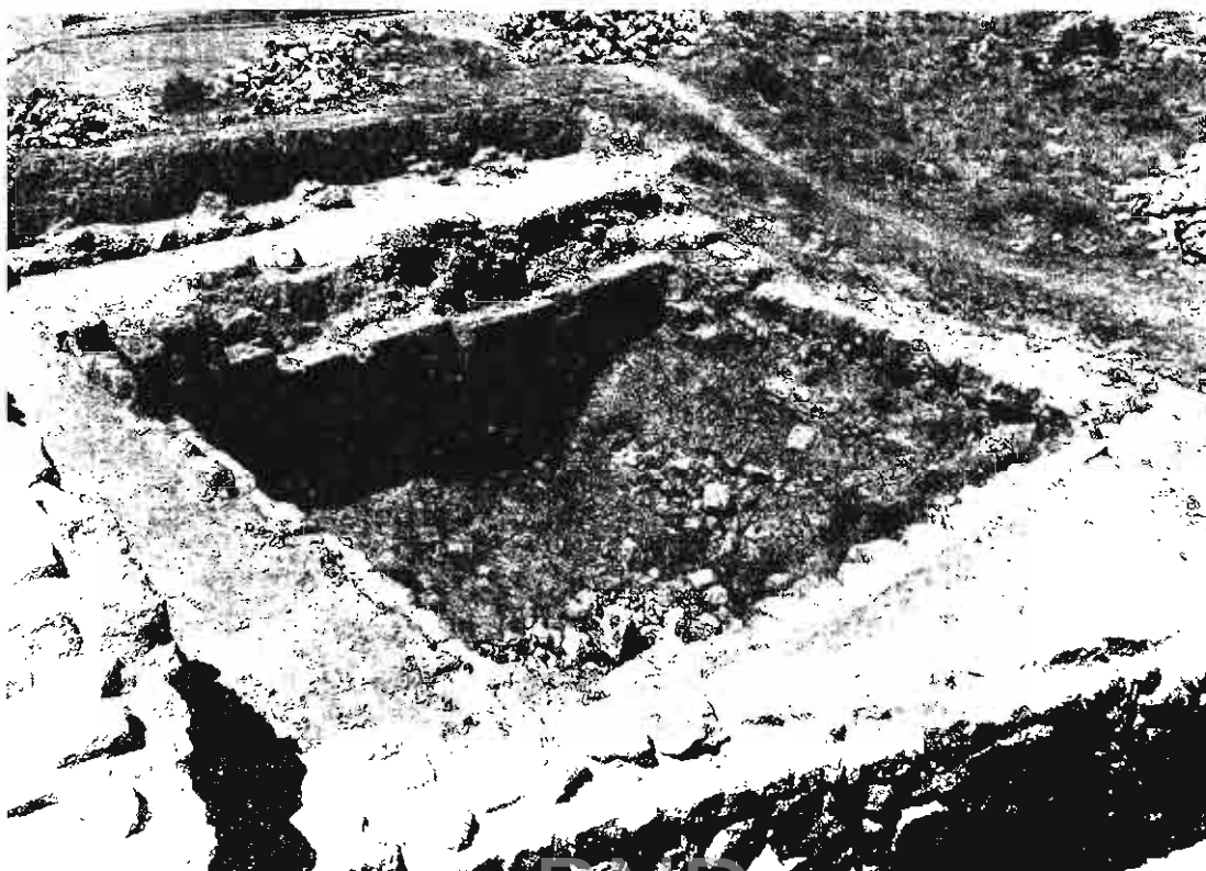
Fot. 2. Aljibe.

pequeño barranco de separación, hoy relleno de piedras, que afecta a la muralla, que en los dos extremos del barranco ha desaparecido.