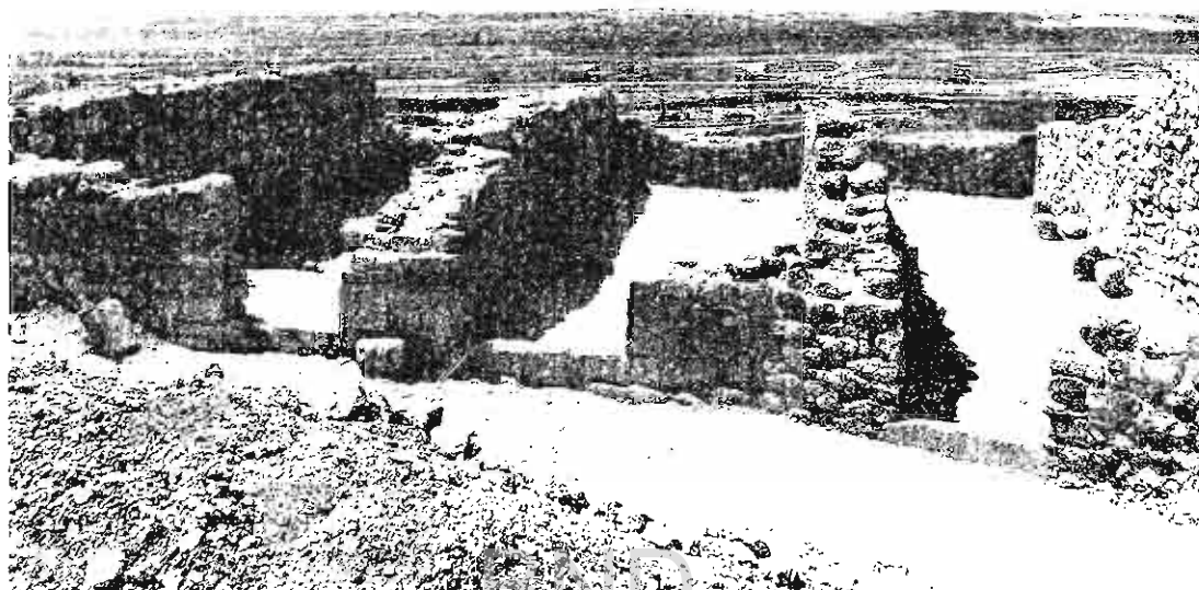
Fot. 3. Casas n.º 1, 2 y 3.

Las casas n.º 4 y 6 no se han excavado totalmente.