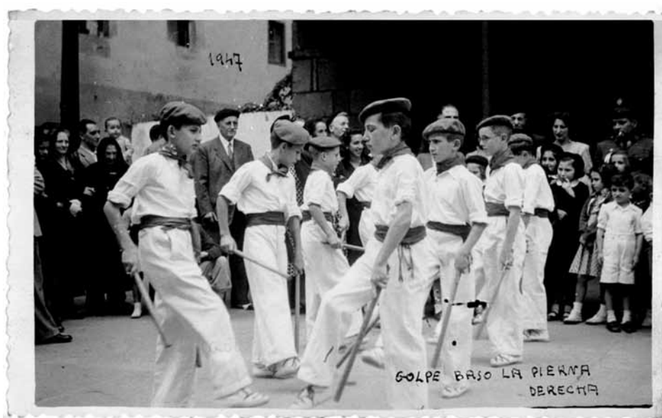
Figura 4. Makil-dantza de Vera de Bidasoa en 1947. Concurso 22. Recopilador: Antonio Goya.

la transcripción musical e indicaciones coreográficas del baile, además de un estudio descriptivo, veinte dibujos en color y tres fotos en blanco y negro (ver apéndice 1 y fig. 4). La makil-dantza de Vera, que los más ancianos de la localidad habían aprendido en su niñez, se bailaba el 3 de agosto, en la fiesta patronal de san Esteban, normalmente por doce jóvenes (aunque también podía bailarse por un grupo de ocho). Goya no pretendió hacer un estudio histórico sobre este baile, sino una detallada descripción de sus movimientos y golpes, “para que sirva de base a los que quieran enseñarlo o practicarlo”. Posteriormente se publicaron varios artículos de Antonio Goya sobre la makil-dantza de Vera 66 .