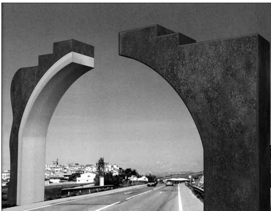
Figura 4. Carlos Ciriza. "Construcciones y vías del Camino".

abierta a la vía de comunicación que el viajero debía atravesar cruzando un gran arco de 6,5 x 12 x 1,5 m, medidas que el artista modificó con posterioridad para dejar mayor espacio de paso a los vehículos de grandes dimensiones.