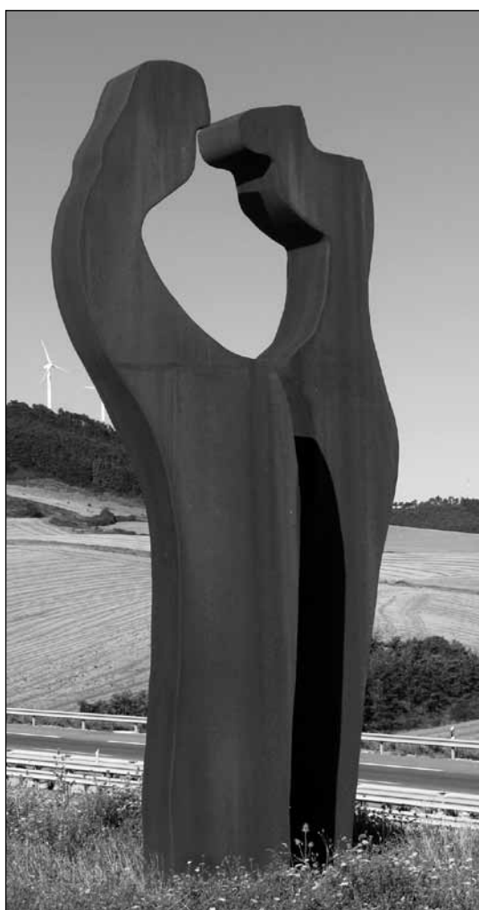
Figura 2. Carlos Ciriza. “Vía Láctea, Caminos Paralelos”.

Atravesado uno de los puntos singulares del trayecto, como es el túnel del Perdón, el viajero se encamina hacia Puente la Reina, donde se hace presente la escultura denominada “Puente paso de Europa” (fig. 3). Fue la primera de las tres piezas del corredor escultórico en instalarse, el 11 de noviembre de 2004, en un área de descanso de la variante de Puente la Reina, en el enlace de Obanos. Realizada en acero cortén y acero inoxidable mate sobre una base de hormigón, con un peso de 44 toneladas y unas dimensiones de 4 x 10 x 1,5 m, el conjunto escultórico recuerda el papel de Puente la Reina como confluencia de varios trazados de la ruta jacobea mediante el elemento que otorga a la villa su silueta inconfundible: el puente románico construido en el si-