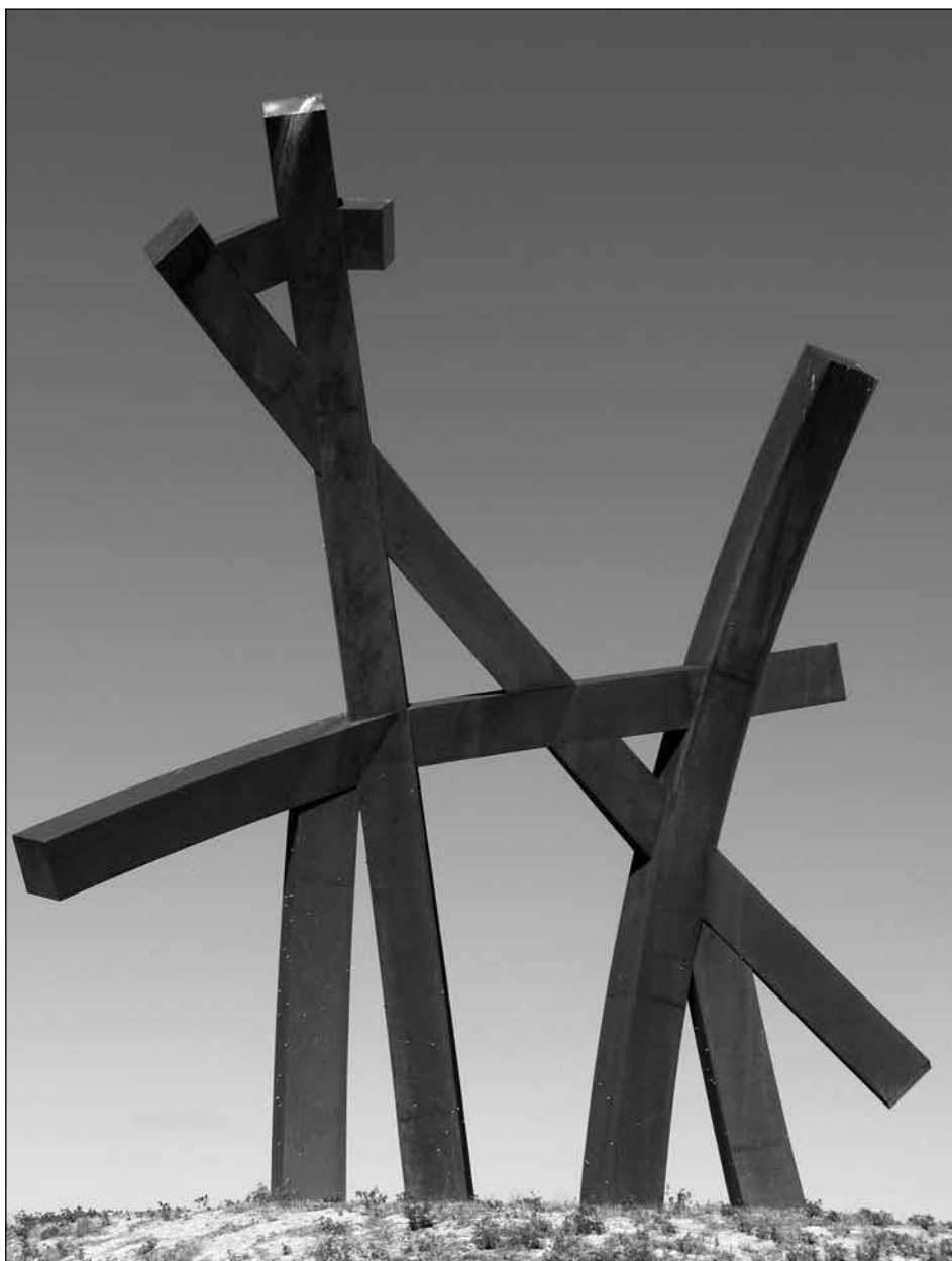
Figura 7. Carlos Ciriza. “Red de Caminos”.

estos nervios permitiría reconstruir por completo el trazado de la nervadura, con su preciso entrecruzamiento a media altura con los convergentes y cerca de su clave con los divergentes de sus caras inmediatas. Sin perder por ello monumentalidad, esta obra se nos muestra transparente y liviana, dotada de una sensación de dinamismo que además de otorgarle belleza estética parece animar al peregrino a avanzar por el Camino.