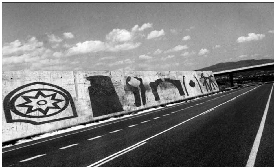
Figura 6. Carlos Ciriza. “Gran mural”.

el corredor escultórico encamina ya su recta final. En su marcado despliegue longitudinal, el conjunto se muestra acorde con la amplitud espacial que ofrece el paisaje.