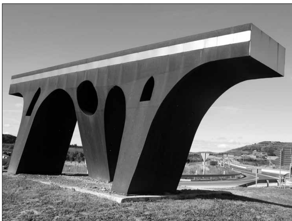
Figura 3. Carlos Ciriza. “Puente paso de Europa”.

glo XI que atraviesa el río Arga y da nombre a la localidad, el cual constituye uno de los más bellos ejemplares de época medieval conservados en Navarra y el más importante de cuantos se cruzan a lo largo del Camino de Santiago. Pero a su vez, el puente de Ciriza adquiere también un significado más profundo al convertirse en símbolo de la comunicación entre personas y de la unión entre pueblos y culturas que representa el Camino de Santiago. Por tal motivo, también los materiales adquieren en esta ocasión un significado concreto, pues así como el acero cortén hace referencia precisa a la tierra, a lo mudable y también a lo originario, el acero inoxidable que mantiene su color gris inalterable nos acerca más a la realidad universal de la ruta jacobea como punto de encuentro 21 . Ciriza acierta a combinar el carácter rotundo de los volúmenes con la apertura de huecos y el diferente tratamiento de los pilares que otorga cierta flexibilidad al conjunto para lograr, a partir de su fuente de inspiración, una obra con personalidad propia en su aparente sencillez.