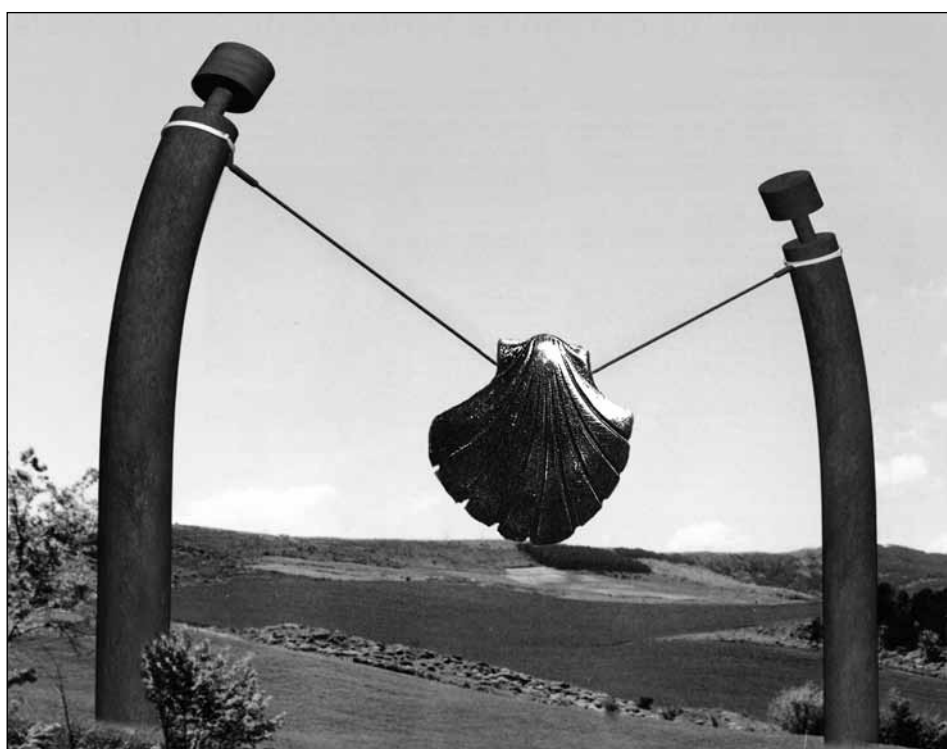
Figura 8. Carlos Ciriza. “La concha, unión de culturas”.

de nuevo el hormigón, acero cortén y acero inoxidable mate eran los materiales previstos para su ejecución. Como último símbolo del corredor escultórico en Navarra, Ciriza quiere trasladar un mensaje de convivencia entre culturas y razas, fruto de la propia experiencia del Camino, que es capaz de unir a personas muy diferentes entre sí. La energía que desprende la ruta jacobea como espacio de integración y elemento de cohesión, queda de manifiesto en el conjunto escultórico, en el que las dos piezas laterales, de un material tan resistente como el acero cortén, se inclinan hacia el interior, doblegadas por la monumental concha jacobea que pende de sus extremos superiores. Con esta última pieza concluía el corredor escultórico de Carlos Ciriza, antes de que el Camino se adentrara en territorio riojano.