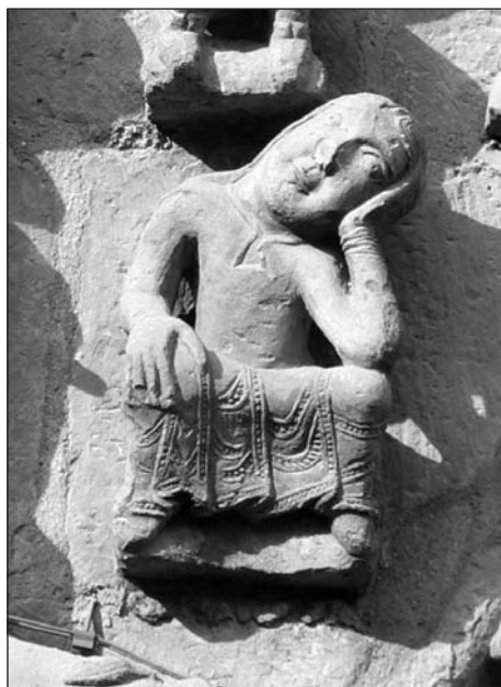
Figura 8: Personaje pensante en la portada de Santa María la Real de Sangüesa.

inspiración en las portadas de la fachada occidental de la catedral de Chartres o en sus derivadas, como la catedral de Le Mans o la prioral de Saint-Loup-de-Naud 37 . Esta filiación, generalmente aceptada, nos abre la puerta a plantear una posible interpretación para el personaje sedente con la cabeza apoyada en la mano que aparece en la enjuta oeste de la portada sangüesina (fig. 8). En dicha postura, asociada al dolor, a la tristeza, al sueño, al pensamiento, a la meditación o a la reflexión 38 , aparecen en ocasiones personajes como san José –en el contexto de la Natividad y la Epifanía–, Caín, el pobre Lázaro –ambos figuran así en las pinturas de San Clemente de Tahull 39 – o Daniel –que realiza este gesto en un 9% del total de las re-