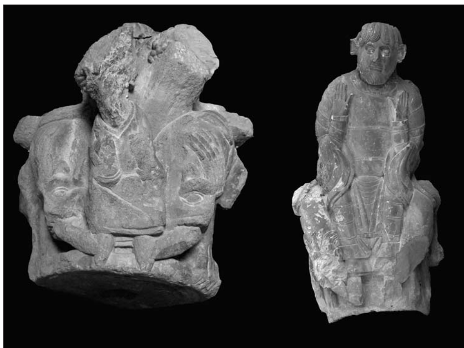
Figura 5: Daniel en el foso de los leones de San Nicolás de Sangüesa (Museo de Navarra) (izda.) y Santa María de Covet (dcha.).

Nicolás presenta exactamente el mismo modelo iconográfico que la arquivolta de Covet: Daniel aparece sentado mostrando las palmas de las manos a la altura del pecho, en señal de aceptación 23 , y es flanqueado por dos leones que curvan sus lomos y agachan sus cabezas hasta lamer los pies del profeta con sus largas lenguas. Como indica Español, efectivamente, este modelo puede tener un origen tolosano, pero no relacionado con el capitel del deambulatorio de San Saturnino de Tolosa, como propone la autora, en el que ni el profeta, ni las fieras, ni la composición presentan similitud alguna con las escenas de Covet y Sangüesa. Leones afrontados con el lomo pronunciadamente curvado, largas garras y con melenas compuestas por mechones en forma de llama se encuentran en diferentes espacios de San Saturnino de Tolosa (portada occidental, capiteles del claustro –Museo de los Agustinos– y puerta Miegerville). Por su parte, la imagen del profeta sedente mostrando las palmas sobre el pecho también encuentra sus paralelos en la escultura del sur de Francia, como por ejemplo en el capitel con el episodio de Daniel del interior del ábside de San Nicolás de Nogaró. Son numerosos los aspectos