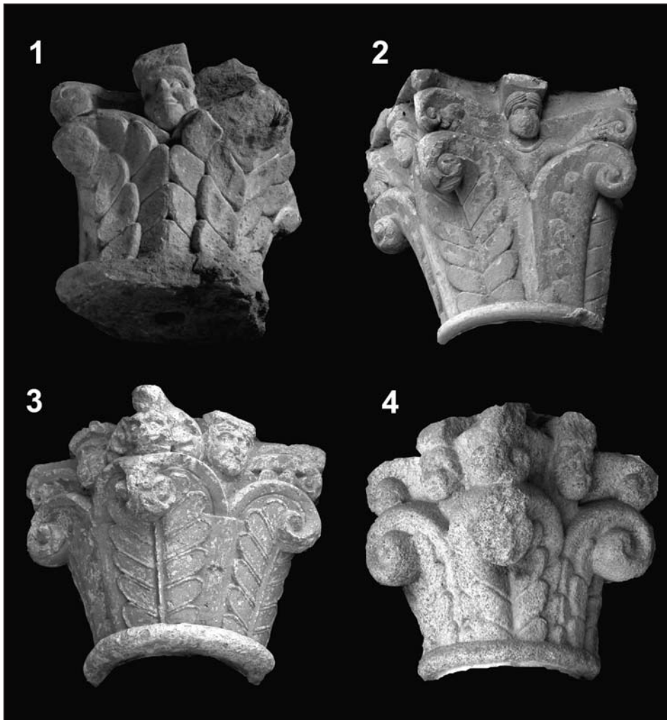
Figura 6: Capiteles con personajes sobre vegetación: 1. San Nicolás de Sangüesa (Museo de Navarra), 2. Santa María de Covet, 3. San Martín Sarroca, 4. Catedral de la Seo de Urgel

Pero la correcta lectura del capitel de San Nicolás no es la única consecuencia de la relación propuesta por Español. La autora cita otros paralelismos existentes entre las piezas de San Nicolás y la escultura de la portada de Covet: un capitel con un personaje que sobresale por encima de un registro vegetal de hojas pinnadas, probablemente de helecho (depósitos del Museo de Navarra, n.º inv. 12) (fig. 6) y otro en el que una pareja de leones afrontados de alargadas garras junta sus cabezas y arquea sus cuerpos (Cámara de