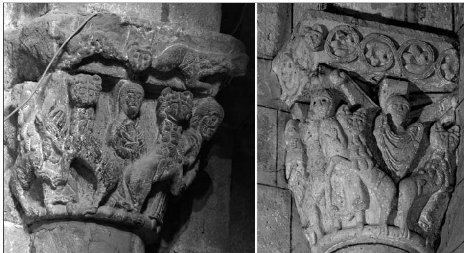
Figura 3: Capiteles de San Pedro de Aibar (izda.) y San Austregisilo de Mouchan (dcha.).

Uranga opina que los capiteles de Aibar derivan de la escuela jaquesa y considera que el capitel que nos ocupa podría representar el episodio de Daniel en el foso de los leones 9 . Lojendio también observa una cierta relación con la escultura jaquesa, pero tras ampliar la nómina de lugares con los que encuentra relación a Loarre, León, Santiago y Tolosa, concluye que nos hallamos ante un arte típico