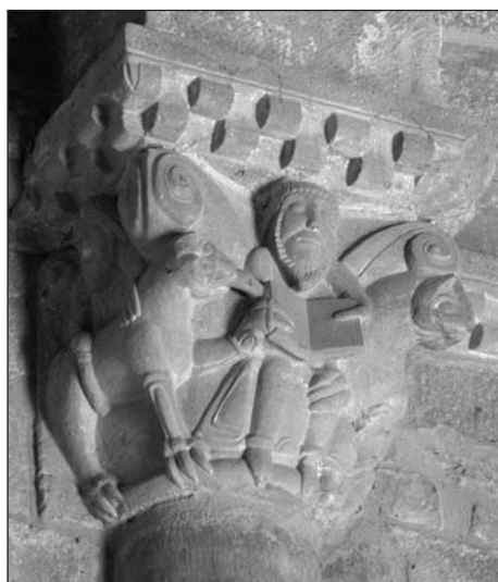
Figura 1: Capitel con Daniel en el foso en el interior de San Pedro ad Vincula de Echano.