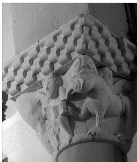
Figura 2: Capitel con Daniel en el foso en el interior de San Pedro de Sarbazan.