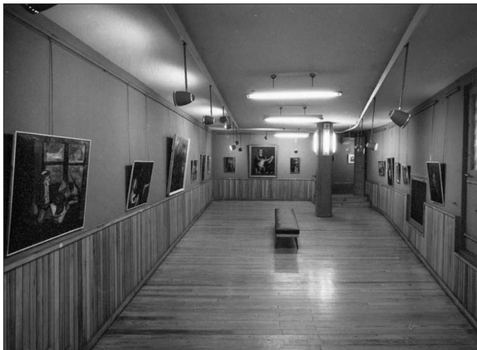
Figura 1. Exposición en sala García Castañón, años sesenta.

La inauguración de García Castañón tuvo lugar en noviembre de 1955, con una exposición de cuadros de Benjamín Palencia 17 , entonces un consagrado