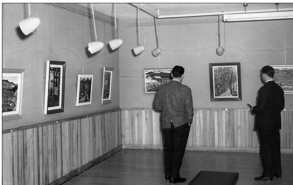
Figura 6. Exposición Retana (1959) en sala García Castañón.