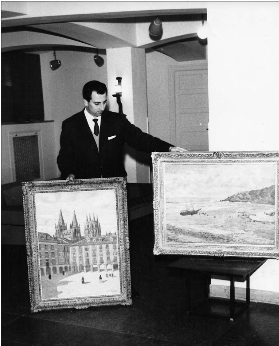
Figura 7. Exposición Darío Regoyos. García Castañón, noviembre de 1964.

tendencias pictóricas más avanzadas como fueron los grabados de Joan Miró o los óleos de Juan Barjola y Joaquín Vaquero Turcios 23 . Todos estos nombres demuestran a las claras el paso que se da en esta sala de arte desde al arte local a un visión del arte global. Las exposiciones colectivas mostraron también el arte más avanzado del momento, con obra de artistas que abrían camino dentro de las nuevas tendencias de la abstracción. En junio del año 1956 se exhibió la exposición titulada «Arte abstracto español», con la presencia de los artistas más rompedores de la vanguardia española; el año 1964 se hizo lo propio con la muestra «Artistas españoles contemporáneos», en donde se exhibía obra de