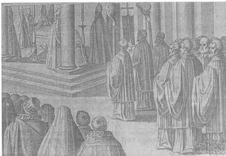
Villamena, F. grabrador

Iglesia Católica, Caeremoniale Episcoporum iussu Clementis VIII... Novissime reformatum... , Romae ex typographia linguarum externarum, 1600 Fondo Antiguo de la Universidad de Navarra