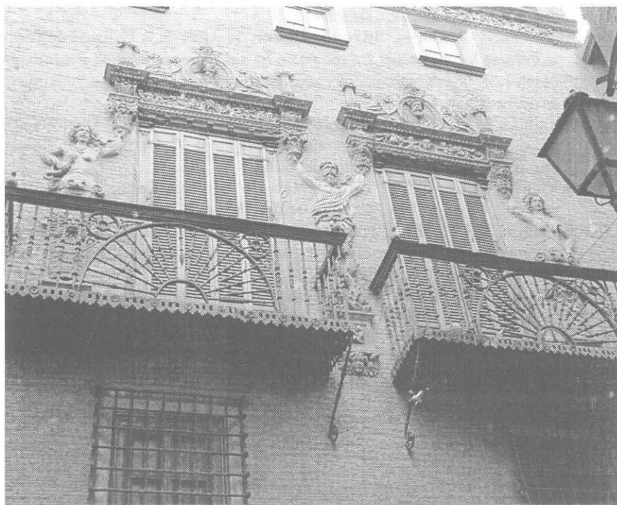
Fig. 1. Tudela. Casa del Almirante