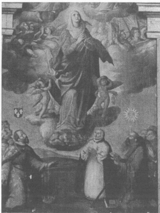
Fig. 4. Cascante. Iglesia del convento de Nuestra Señora de la Victoria. Capilla de don Luis Enríquez Cervantes de Navarra. Detalle del retablo